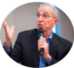
Prof. Alan V. Oppenheim